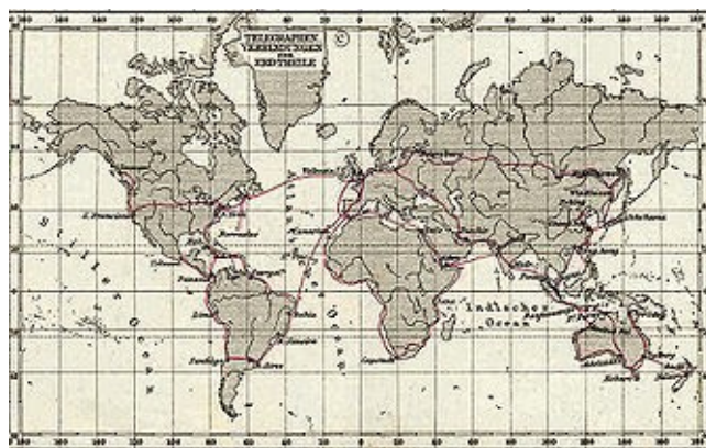
Telegraf-linioj en la jaro 1891

73, kiu en tiu tempo signifis “amon kaj kisojn”. Pluaj eldonoj de tiu gvidilo konservis la saman signifon, sed pli poste 73 signifis ĝeneralan finsaluton fratecan inter la operatoroj sen mencio al la romantika signifo de la komencaj jaroj. En la jaro 1859 la kompanio Western Union aperigis la gvidilon Standard 92 Code . Tiu gvidilo anstataŭigis ordinarajn ĉiutagajn frazojn per elektitaj ciferoj inter 1 kaj 92. En la ricevstacio, la numeroj estis elkodigitaj kaj tiam transskribitaj per ordinara lingvo kaj liverataj al la adresitoj.